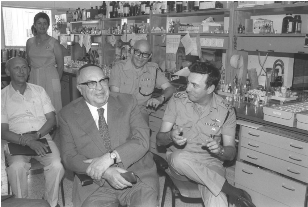
תצלום 1 . כשעוד היו חיוכים

ציבוריים בכלל ורגישים בפרט. ככלל ניתן לומר כי עולם המינויים בכלל והמינויים הנעשים עלידי דרג פוליטי, אינו מנותק משיקולים פוליטיים – במובן הרחב של המושג פוליטיקה.