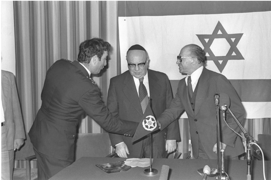
תצלום 6 . מונה בזכות מעלותיו - הודח בגלל מגרעותיו